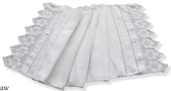
III nagroda Dorota Jurkowska z Puław